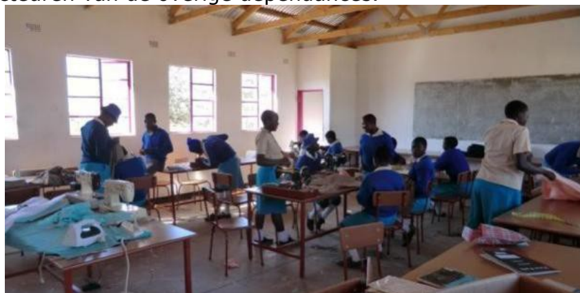
Het lokaal voor Mode en Kleding bij de LHS, dit moet er ook komen voor de dependances.

+ nog 4 directeuren van de overige dependances.