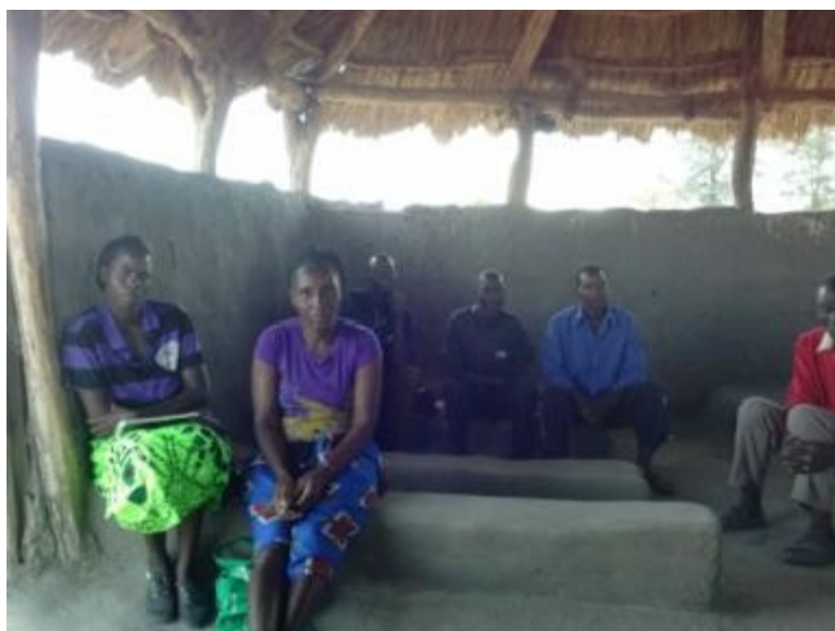
Vergaderen met de oudercommissie in Nakaluba

Wij verwachtten daarbij gemiddeld een eigen bijdrage vanuit de betreffende bevolking van 25 %.